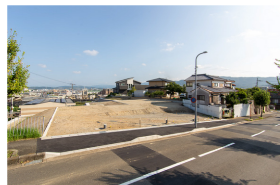
※現地写真(2024年9月撮影)